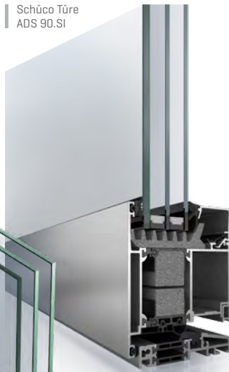
Schüco Türe ADS 90.SI